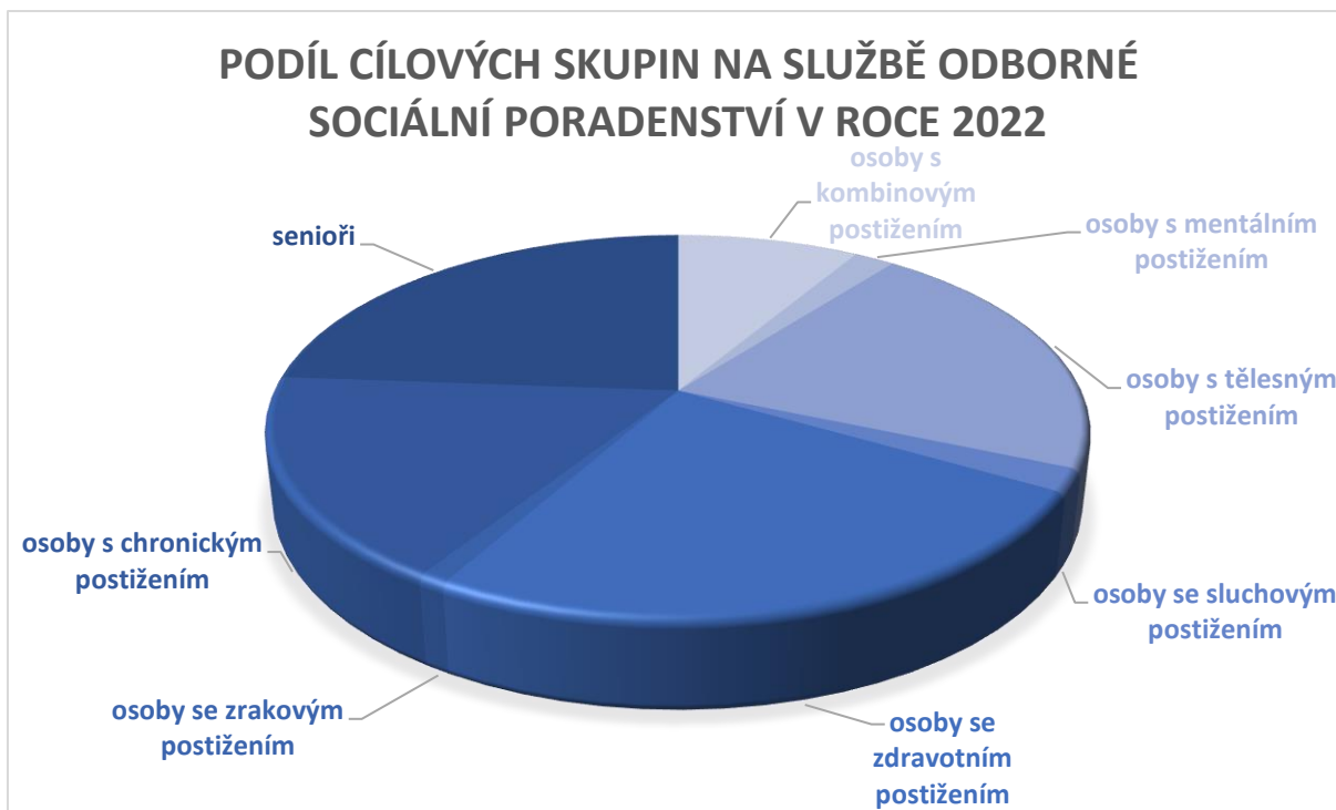
graf č. 1 Podíl cílových skupin na službě odborné sociální poradenství v roce 2022

V grafu nazvaném "Podíl cílových skupin na službě odborného sociálního poradenství v roce 2022" je prezentováno, kolik různých cílových skupin využilo odborné sociální poradenství během tohoto roku. Počet 412 klientů je rozdělen do cílových skupin: